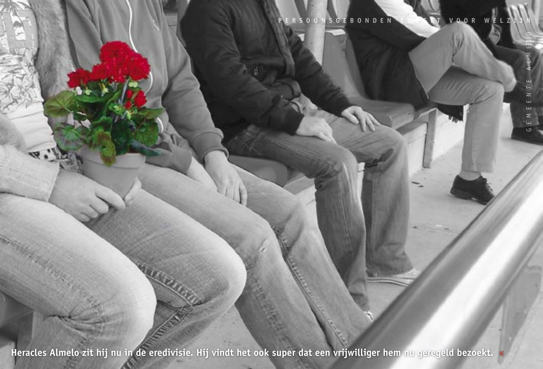
Heracles Almelo zit hij nu in de eredivisie. Hij vindt het ook super dat een vrijwilliger hem nu geregeld bezoekt. «